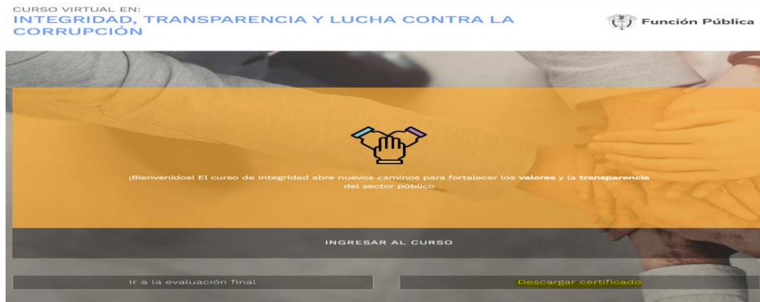
Ilustración 4. Opción de descarga de certificado

Al ingresar al curso de Integridad, se desplegarán las opciones disponibles. En este menú debe hacer clic en la opción “ Descargar certificado ”.