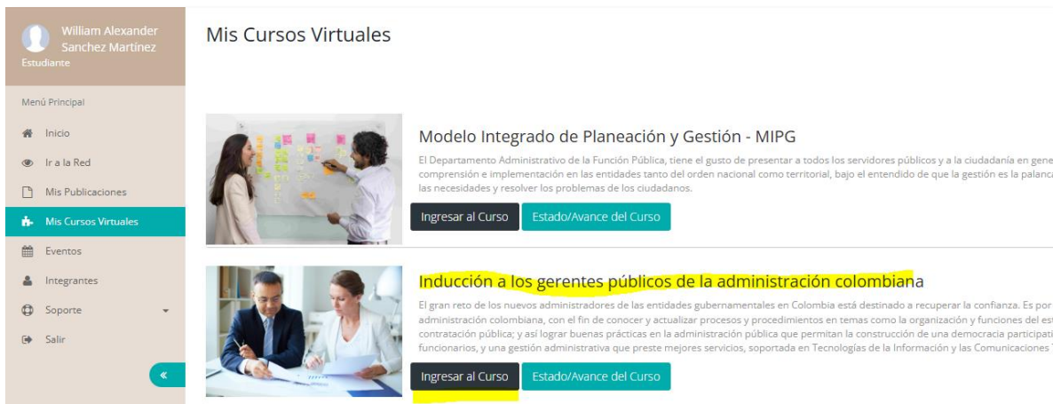
Ilustración 9. Ingreso al curso gerentes públicos

Luego de identificar el curso en la plataforma, haga clic en el botón “ Ingresar al curso ” para acceder al contenido y continuar con el proceso de formación.