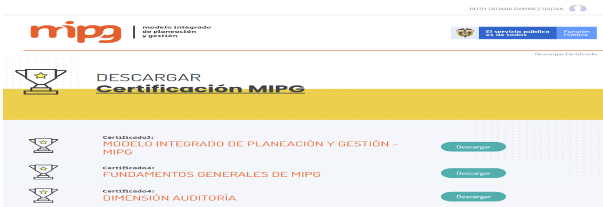
Ilustración 8. Vínculos de descarga de certificado