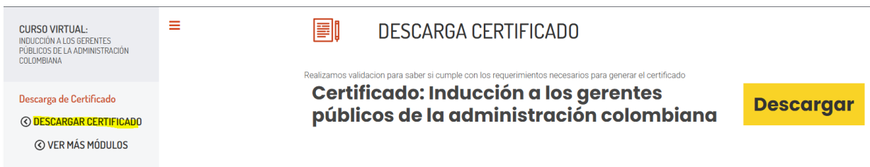
Ilustración 11. Enlace de descarga de certificado en el módulo

Al ingresar al módulo, ubique y haga clic en el enlace "Descargar Certificado" . Posteriormente, el sistema abrirá el documento en formato PDF.