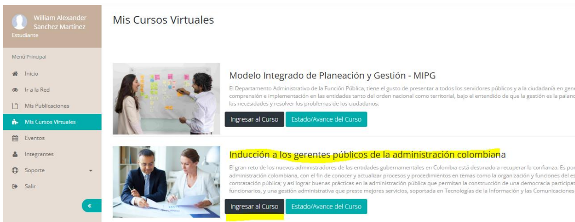
Ilustración 9. Ingreso al curso gerentes públicos

Luego de identificar el curso en la plataforma, haga clic en el botón “ Ingresar al curso ” para acceder al contenido y continuar con el proceso de formación.