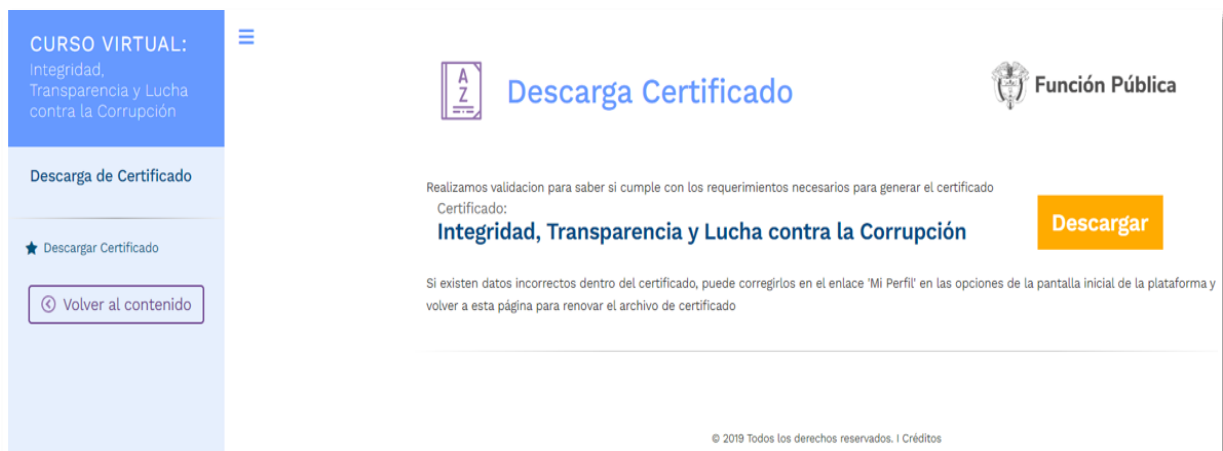
Ilustración 5. Vínculo de descarga del certificado

Una vez dentro del curso y en la opción de descarga certificado , se mostrará el vínculo habilitado para obtener el documento en formato PDF. Al hacer clic en dicho vínculo, el sistema generará el certificado