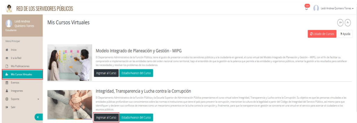
Ilustración 3. Ingreso al curso Integridad

Luego de identificar el curso en la plataforma, haga clic en el botón “Ingresar al curso” para acceder al contenido y continuar con el proceso de formación.