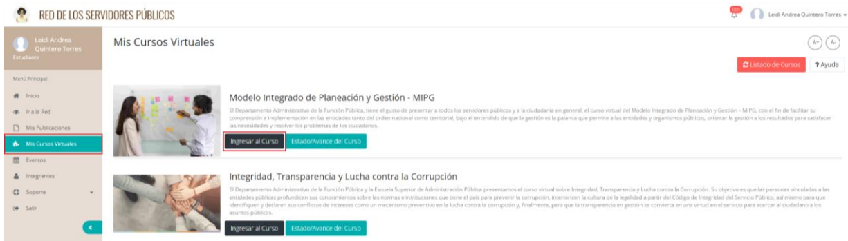
Ilustración 6. Ingreso al curso MIPG

Luego de identificar el curso en la plataforma, haga clic en el botón “ Ingresar al curso ” para acceder al contenido y continuar con el proceso de formación.