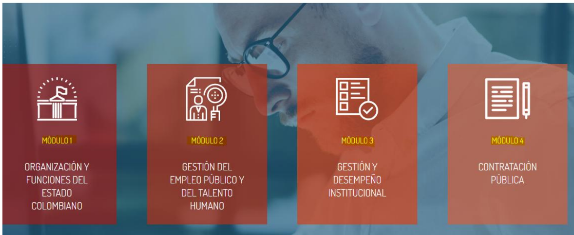
Ilustración 10. Vista de módulos del curso gerentes públicos

Al ingresar al módulo, ubique y haga clic en el enlace "Descargar Certificado" . Posteriormente, el sistema abrirá el documento en formato PDF.