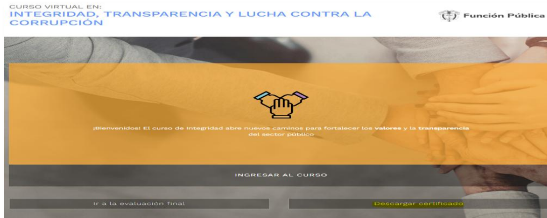
Ilustración 4. Opción de descarga de certificado

Al ingresar al curso de Integridad, se desplegarán las opciones disponibles. En este menú debe hacer clic en la opción “Descargar certificado” .