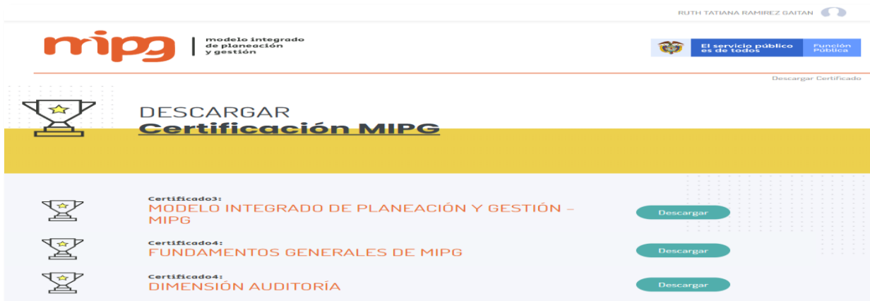
Ilustración 8. Vínculos de descarga de certificado