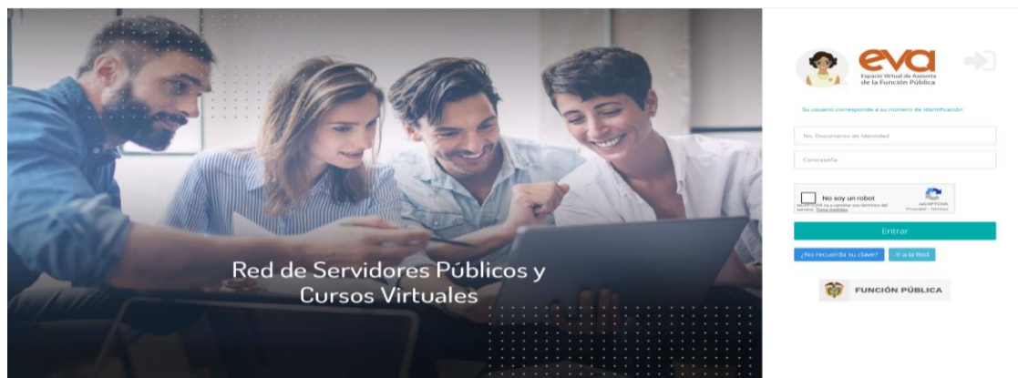
Ilustración 1. Ingreso a EVA