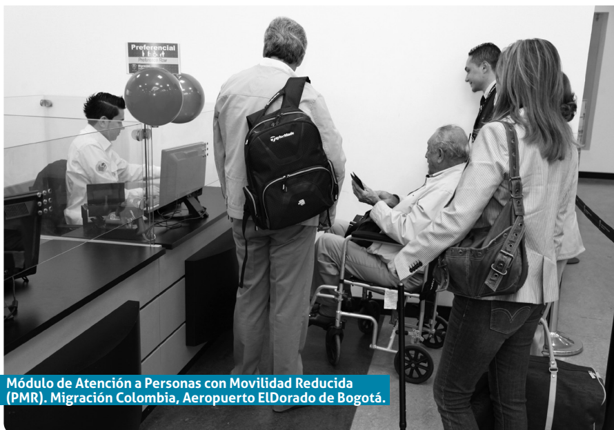
Módulo de Atención a Personas con Movilidad Reducida (PMR). Migración Colombia, Aeropuerto EL Dorado de Bogotá.

Cuando las personas con discapacidad lleven un acompañante o un intérprete, diríjase a ellas desde el inicio de la conversación ya que serán las que le indicarán si ellas mismas realizarán la consulta o prefieren que sea quien las acompaña.