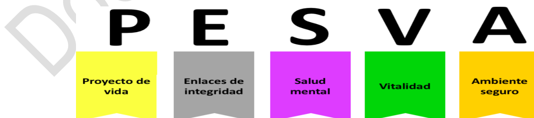
Gráfica 2: Formulación del Programa

Acorde con los resultados relacionados anteriormente y definiendo las áreas que se interrelacionan entre los procesos de Bienestar Social, Capacitación y Seguridad y Salud en el Trabajo; se definen los siguientes ejes de intervención cuyas iniciales dan el nombre al programa: